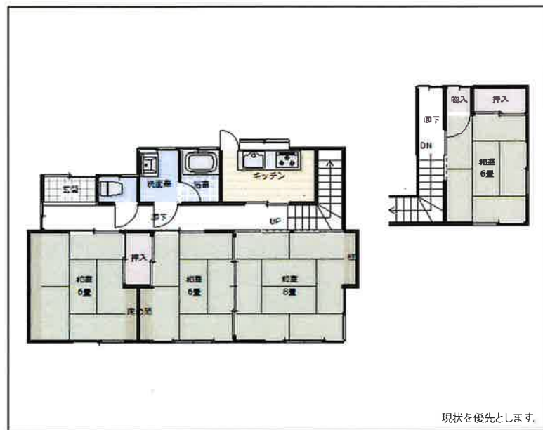
現状を優先とします。